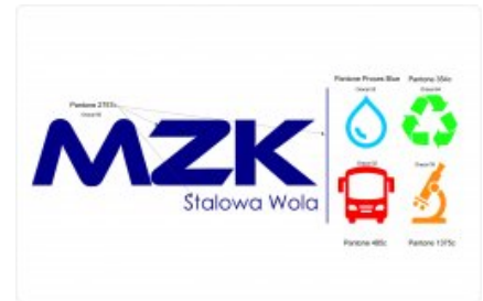
Logo MZK Stalowa Wola - rysunek poglądowy

Zakup i dostawa kontenerów typu mulda o pojemności min. 7 m 3 przeznaczonych do zbiórki odpadów dla Miejskiego Zakładu Komunalnego Sp. z o.o. z siedzibą w Stalowej Woli