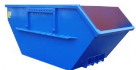
Przykładowe rysunki kontenerów