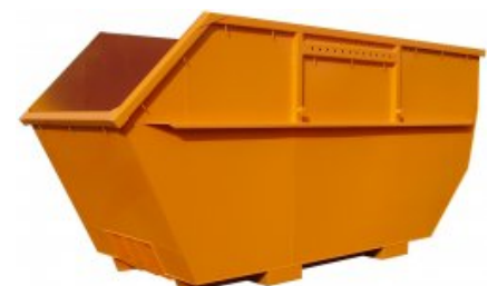
Przykładowe rysunki kontenerów